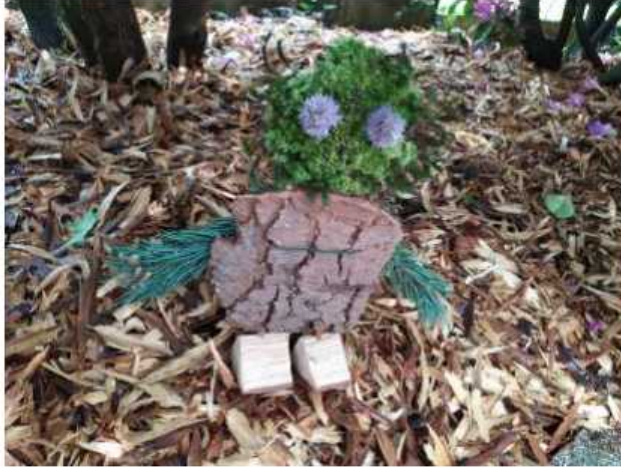
Mathilde Célarié 6 ème 4