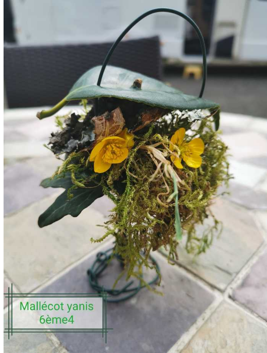
Mallécot yanis 6ème4