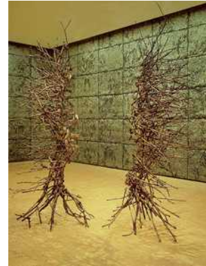
Giuseppe PENONE, Peau de Feuilles, 2020, Sculpture en bronze, Centre Pompidou, Paris

Pour en savoir plus sur Giuseppe Penone :