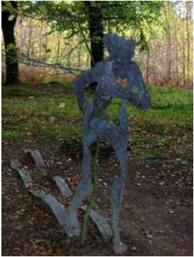
Giuseppe PENONE, Sentier de Charme, 1986, Sculpture en bronze, Kerguelennec

ARTE POVERA/ Giuseppe Penone : Certains artistes ont utilisé la nature pour créer leurs oeuvres d'art. On dit de ces artistes qu'ils font de l'arte povera . C'est un mot italien qui veut dire « art pauvre ».L'art pauvre s'oppose aux arts nobles pour lesquels il faut un matériel particulier qui peut coûter cher (les toiles pour peindre par exemple). Ici, les artistes utilisent plutôt des matériaux naturels, ou bien du tissu, de la corde, etc.Un des artistes majeurs de l'Arte Povera est Giuseppe PENONE. C'est un artiste italien qui travaille avec les arbres. Il les utilise, les modifie, les copie.